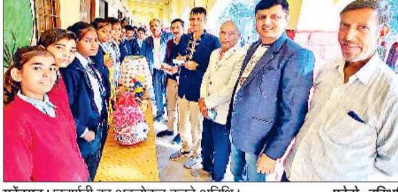
महेन्द्रगढ़। प्रदर्शनी का अवलोकन करते अतिथि।