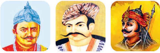
राजा नाहर सिंह राजा राव तुलाराम महाराणा प्रताप