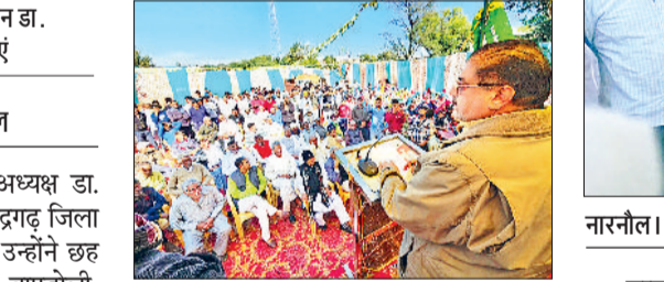
नारनौल। ग्रामीण जनसभा को संबोधित करते डा. अजय सिंह चौटाला।