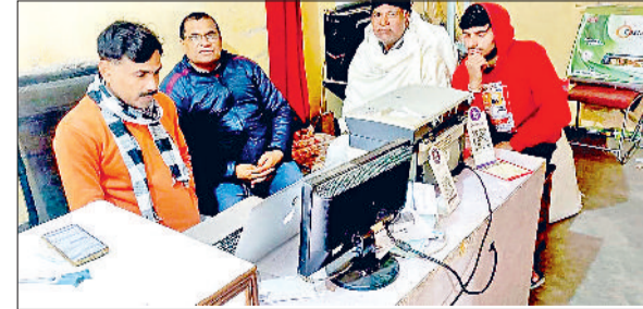
नारनौल। सीएससी सेंटर पर किसान फसल पंजीकरण करवाते हुए।

किसानों को न्यूनतम समर्थन मूल्य पर अपनी फसल बेचने के लिए मेरी फसल मेरा ब्यौरा पोर्टल पर पंजीकरण करना ज़रूरी है। पंजीकरण होने के बाद ही किसान अपनी फसल को मंडी में सरकारी मूल्य पर बेच सकता है। अबकी बार सरकार ने रबी फसल पंजीकरण के लिए परिवार पहचान पत्र ज़रूरी किया है। फसल ब्यौरा दर्ज करने के लिए परिवार पहचान पत्र में दर्ज मोबाइल पर ओटीपी भेजा जाता है। सही ओटीपी दर्ज होने के बाद ही पोर्टल खुलता है। इसके बाद किसान अपने जिले, तहसील तथा गांव का चयन करने के बाद फसल