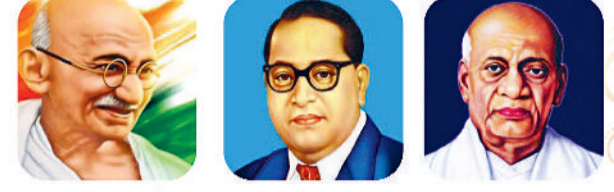
महात्मा गांधी डॉ. भीमराव अम्बेडकर सरदार वल्लभभाई पटेल

स्थान: नई अनाज मंडी, चरखी दादरी प्रीतिभोज : प्रातः 11:00 बजे से