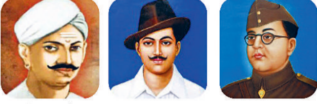
मंगलपाण्डे शहीद भगत सिंह सुभाष चन्द्र बोस