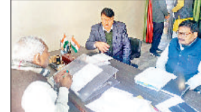
नारनौल। अधिकारियों की बैठक लेते राज्यमंत्री ओमप्रकाश यादव।

राज्यमंत्री ओमप्रकाश यादव ने शुक्रवार को अपने कैब कार्यालय में जन स्वास्थ्य व पंचायत विभाग के अधिकारियों की आवश्यक बैठक ली। उन्होंने जिला में इन विभागों की ओर से किए जा रहे विभिन्न विकास कार्यों व परिवोजनाओं की समीक्षा की तथा आवश्यक दिशानिर्देश दिए। इस अवसर पर यादव ने कहा कि नगर परिषद में जो नए गांव जोड़े गए थे, उनमें अमृत-2 योजना के तहत सर्वे का कार्य पूरा हो चुका है। ऐसे में इन गांव में पेयजल, सीवरेज व गालियों के निर्माण से संबंधित