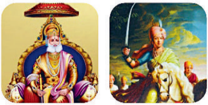
महाराज अग्रसेन रानी लक्ष्मीबाई