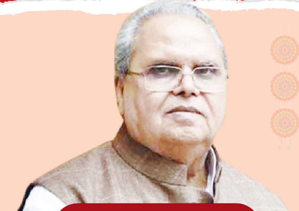
मुख्यातिथि माननीय श्री सत्य पाल सिंह मलिक प्रसिद्ध भारतीय राजनीतिज्ञ एवं पूर्व राज्यपाल- जम्मू कश्मीर, गोवा, बिहार एवं मेघालय