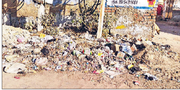
नारनौल। शहर में पड़ी गंदगी।

महेन्द्रगढ़ की स्वच्छता रैंक 63वीं, नारनौल की 68, नांगल चौधरी की 76वीं, कनीना की 86 व अटेली शहर को मिली 86वीं रैंक 2022 में भी नारनौल को मिला था शून्य अंक